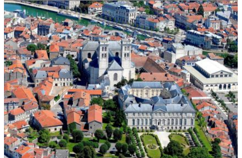
Vue aérienne de la ville haute de Verdun