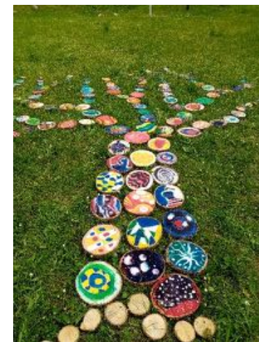
Atelier scolaire autour de l'arbre de Beaumont-en-Verdunois, 2021