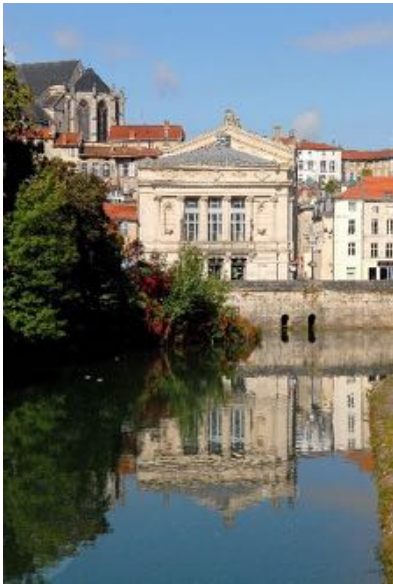
Théâtre de Verdun