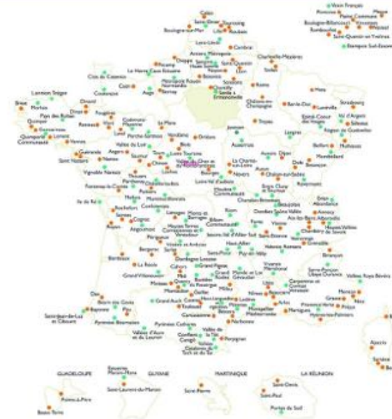
Carte des villes et Pays d'art et d'histoire 2023