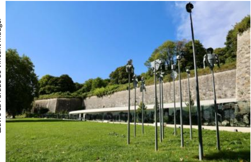
Œuvre La Parade de Vincent Mauger