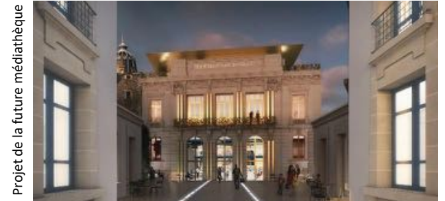
Projet de la future médiathèque